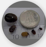
Tique femelle à pattes noires aux divers stades de l'engorgement†